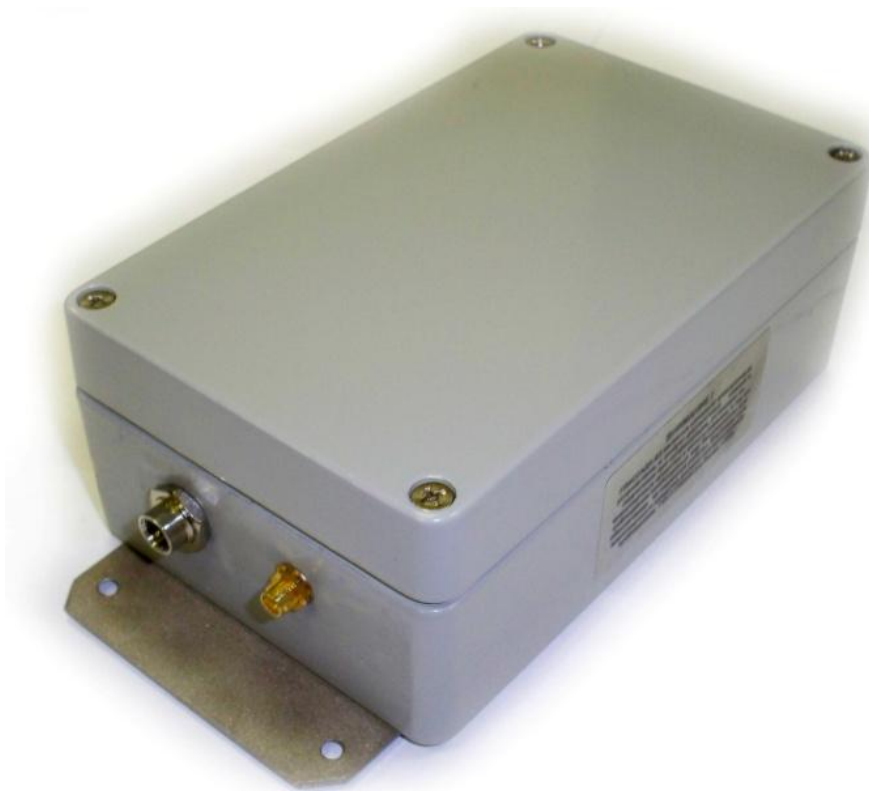
Внешний вид ЦБУН изделия “ГЛИССАДА-Б2” ( со стороны высокочастотных разъемов)