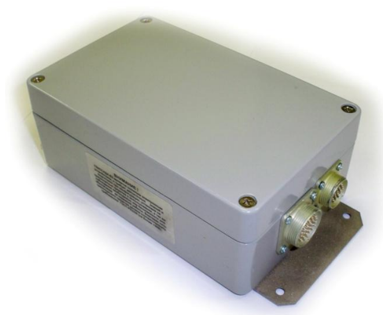
Изделие “ ГЛИССАДА-Б2”

Изделие ГЛИССАДА-Б2 предназначено для ориентации, стабилизации и навигации бронетанкового вооружения и военной автомобильной техники (БТВТ и ВАТ) в условиях радиоэлектронного подавления и закрытой местности.